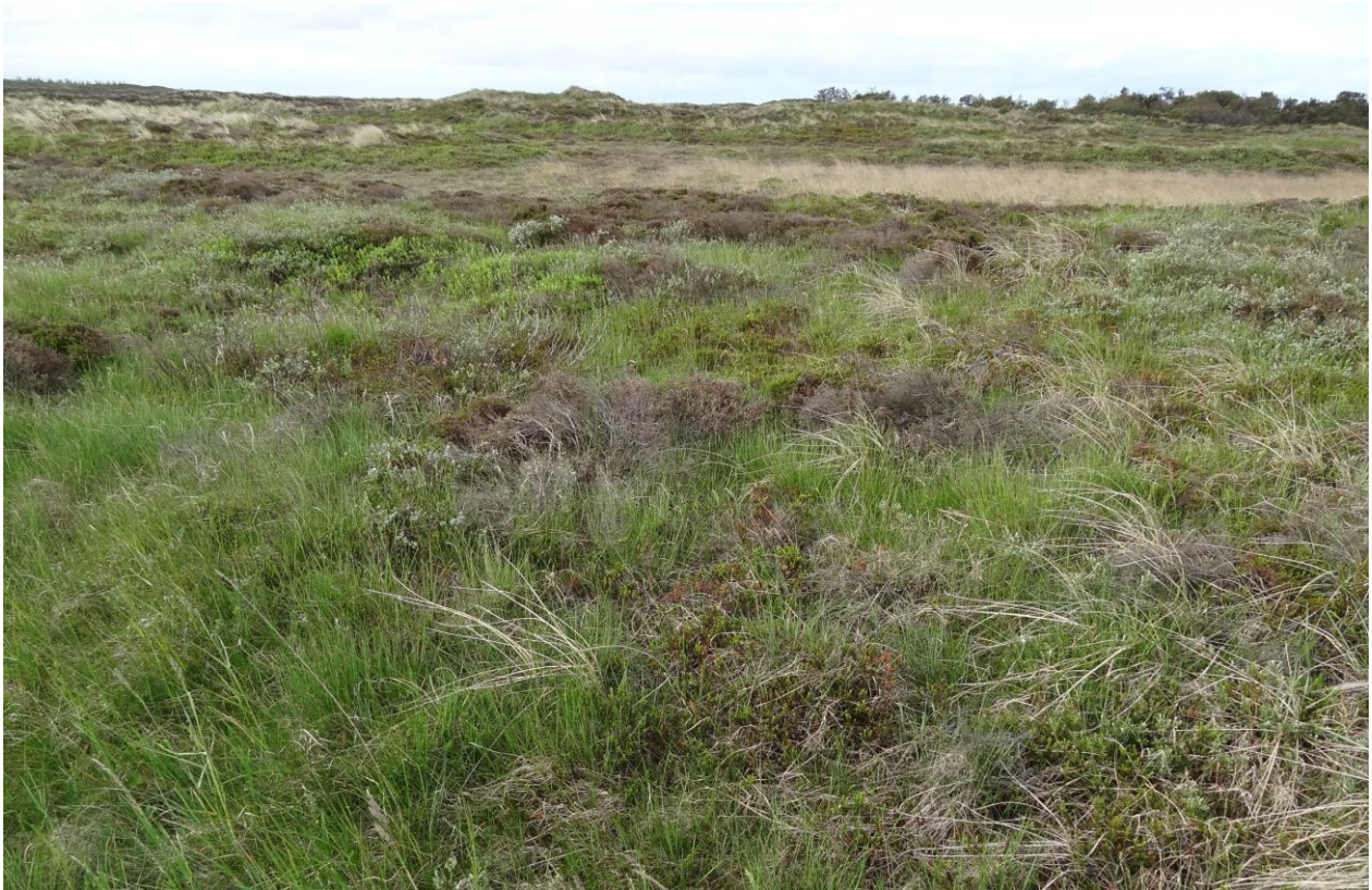
Klithede syd for Lyngby. Klithede er en af de prioriterede naturtyper der er på udpegningsgrundlaget for området.

Indsatsen vil helt overvejende dreje sig om at sikre de lysåbne naturtyper ved drift/pleje af naturtyperne f.eks. i form af græsning og rydning af opvækst samt gennemføre en indsats over for invasive plantearter. Vandafhængige naturtyper skal sikres den for naturtyperne mest hensigtsmæssige hydrologi. For skovnaturen sikres en naturtypebevarende drift. Der sikres velegnede levesteder for stor vandsalamander som er på områdets udpegningsgrundlag.