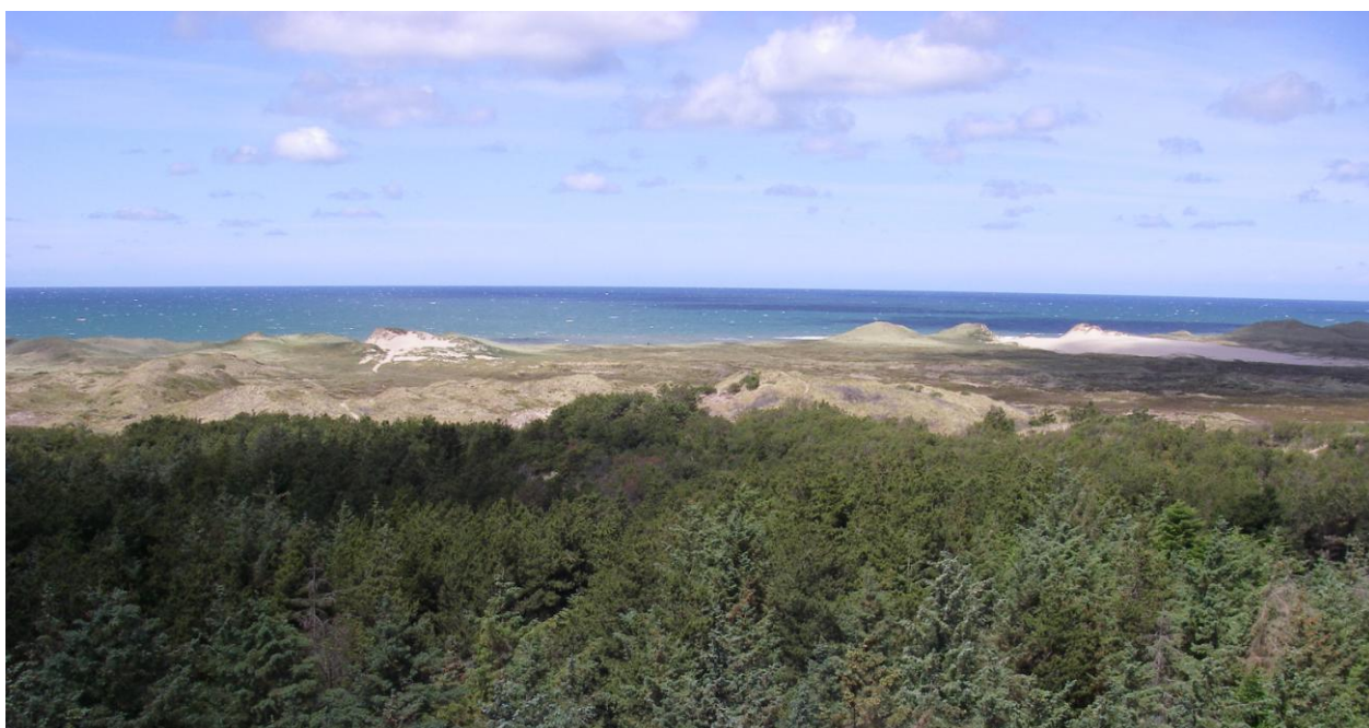
Udsigten fra Lodbjerg Fyr ud over klit landskabet og Vesterhavet.

I handleplanen anvendes en række Natura 2000-begreber m.m., som er defineret nærmere i bilag 5.