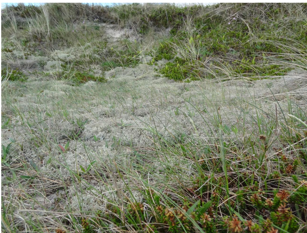
Grå/grøn klit, som er en prioriteret naturtype. Billedet er taget syd for Lyngby.