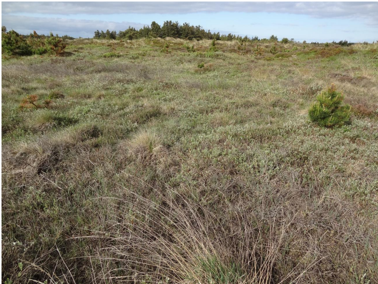
Klitlandskab syd for Lyngby. Bjergfyr i forgrunden.

Mere naturlige vandstandsforhold kan være en afgørende forudsætning for, at våde naturtyper som f.eks. klitlavning og våd hede kan opnå gunstig bevaringsstatus. Dette gælder også for en række arter tilknyttet våde naturtyper.